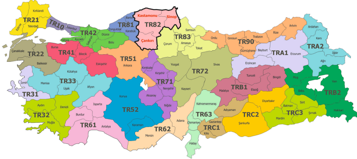
Harita 1: Düzey 2 Bölgeleri

İstatistikî Bölge Birimleri Sınıflandırılmasına (İBBS) göre Türkiye, 26 düzey-2 bölgesine ayrılmıştır. TR82 Bölgesi Kastamonu , Çankırı ve Sinop'tan oluşmaktadır.